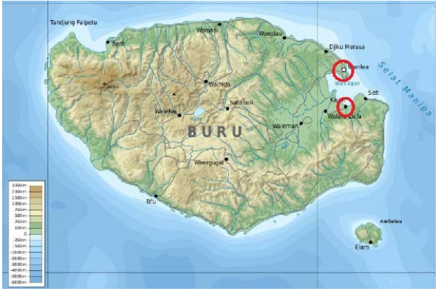
Peta 1. Judul peta