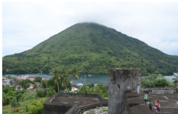
Gambar 1. Judul